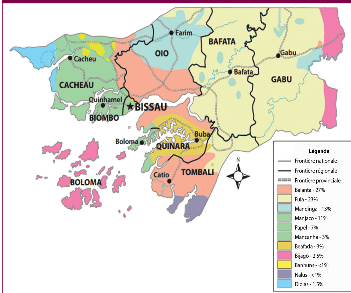
Figura 2. Distribuição geográfica dos grupos étnicos da Guiné-Bissau